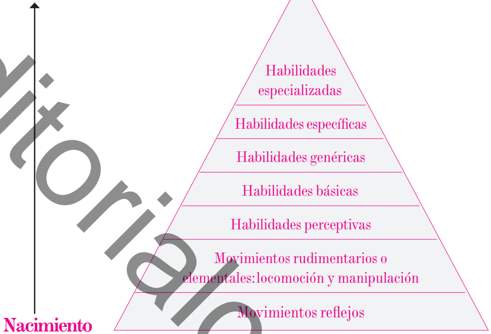
Figura 2: Progresión evolutiva de las habilidades motrices

cognitivas, emocionales, simbólicas y sensoriomotrices en la capacidad de ser y de expresarse en un contexto psicosocial, desempeñando un papel fundamental en el desarrollo armónico de la personalidad. Partiendo de ésta concepción se desarrollan distintas formas de intervención psicomotriz que encuentran su aplicación cualquiera que sea la edad, en los ámbitos preventivo, educativo, reeducativo y terapéutico”.