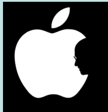
¿Una manzana o un hombre?