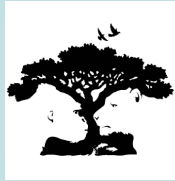
¿Un árbol o dos animales?