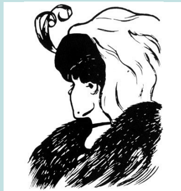
¿Una mujer joven o anciana?