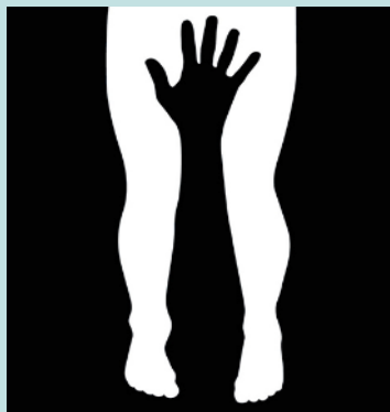
¿Dos piernas o un brazo?