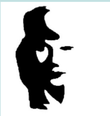
¿Una mujer o un hombre tocando el saxofón?