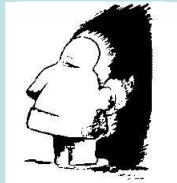
¿Cabeza de un indio americano o un esquimal?