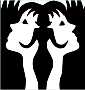
Una mujer o dos?